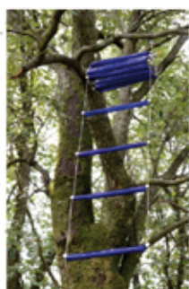
La scala in vetro di Vittorio Corsini

Un giardino, sei artisti, una mostra. Meriggio 2 a Carignano generazioni a confronto, è un viaggio nell'arte contemporanea che si snoda attraverso il frutteto, le piante ornamentali, la limonaia di villa al Console a Carignano (Lucca), una residenza privata che si apre ai linguaggi dell'arte da oggi fino al 4 novembre (visitabile sabato e domenica su appuntamento, info +39 333 2220553 / leopoldina@uscitalucca.it). Curata da Ludovico Pratesi, porta tra le siepi e le aiuole di questo