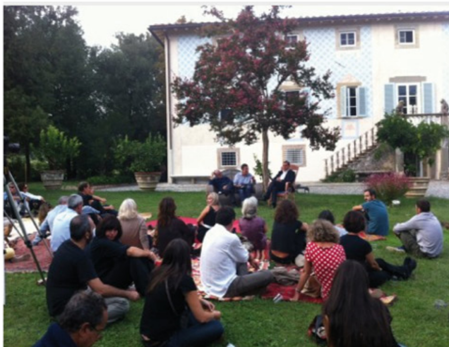
In conversazione al Meriggio